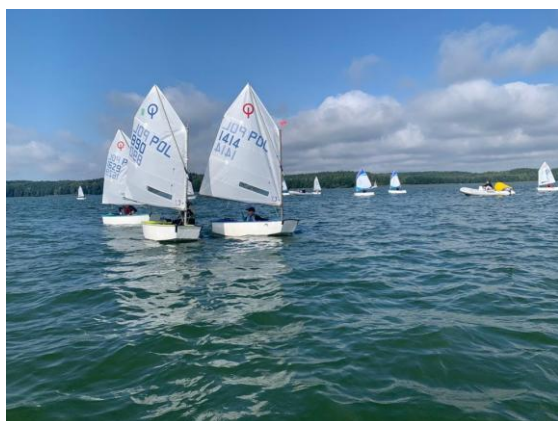
Fot. 3 Regaty na j. Rychnowskim