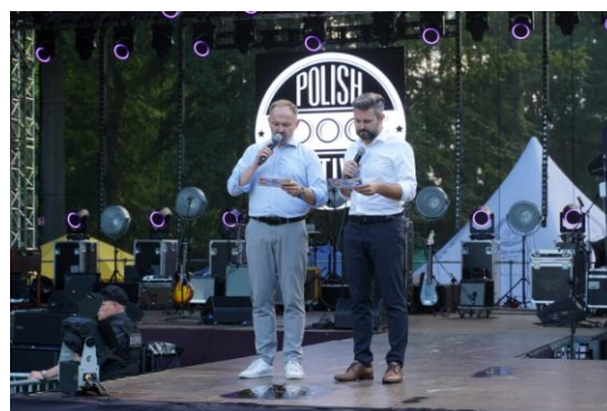
Fot. 2 Polish Boogie Festival