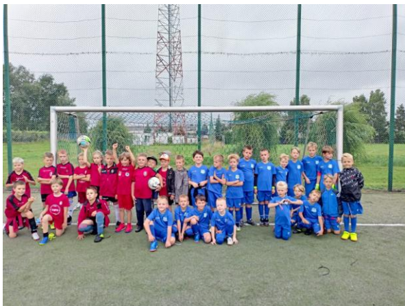
Fot. 5 Letnie Półkolonie z Piastem

Dzięki wykorzystaniu dotacji w wysokości 69 960,00 zł zrealizowano zadania na rzecz wypoczynku letniego dzieci i młodzieży o łącznej wartości 164 192,98 zł .