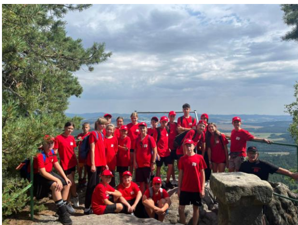
Fot. 7 „Ze strażakami na sportowo”