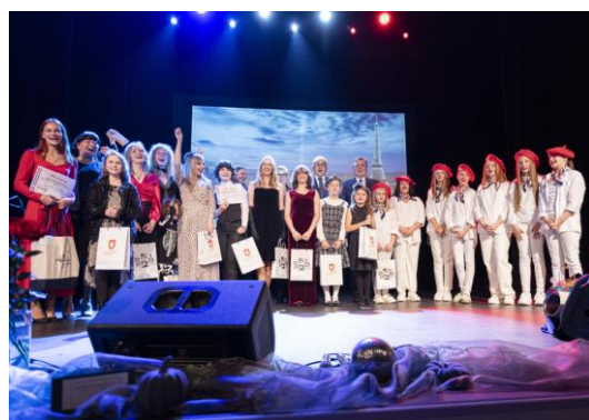
Fot. 1 Dni Kultury Francuskiej