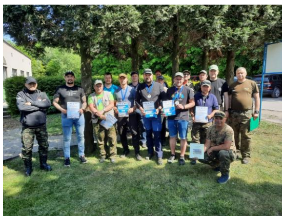
Fot. 4 Zawody wędkarskie