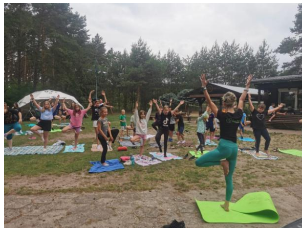
Fot. 6 Półkolonia żeglarska