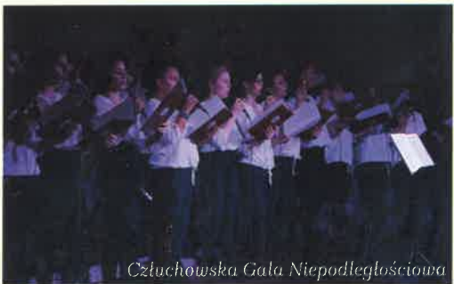
Człuchowska Gala Niepodległościowa

„Słodkości na Dzień Niepodległości”, a nawet pobór krwi i konkurs na laurkę z życzeniami dla Ojczyzny. Nie zabrakło też tradycyjnych uroczy-