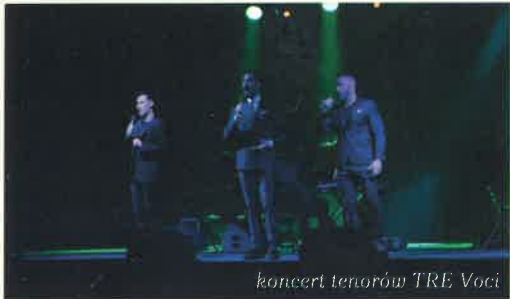
koncert tenorów TRE Voci

Trzydniowy finał człuchowskich obchodów uświetniły koncerty, widowiska teatralne,