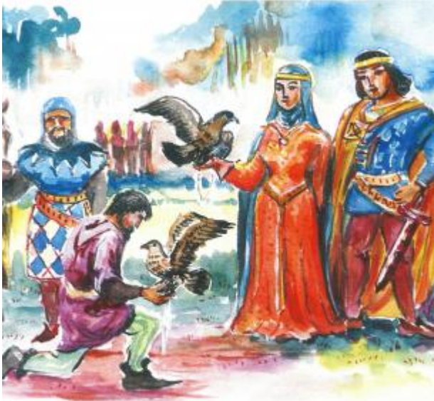
Georgia z mężem i