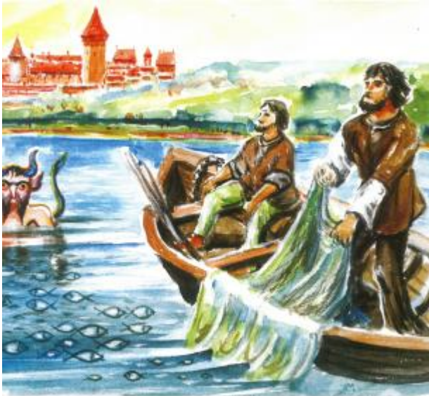
Czart Rychonek pomagający rybakom w polu